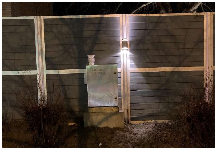
Figur 14 Centralesplanaden-Nygatan, Örnköldsviks kommun