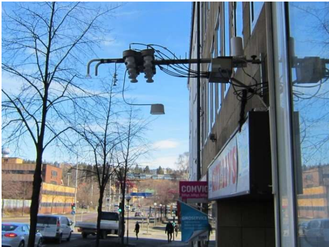
Figur 13 Centralesplanaden.