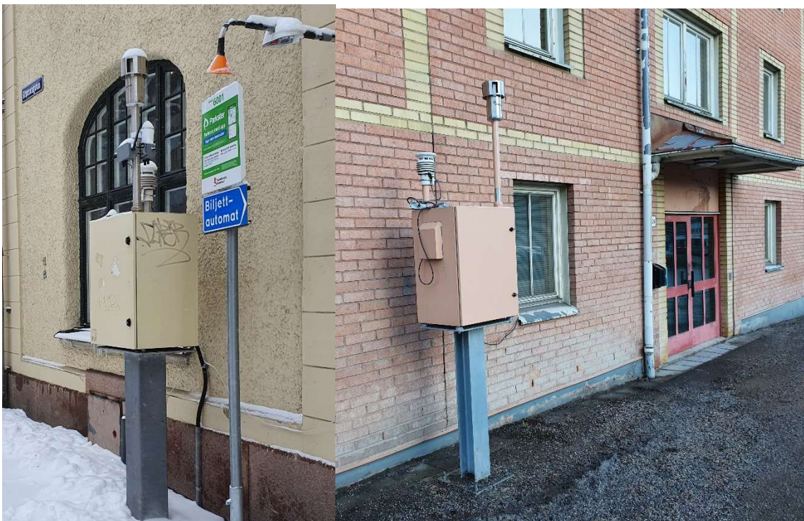
Figur 6 Köpmangatan, figur 7 Bergsgatan, Sundsvalls kommun